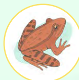
Rana de patas rojas