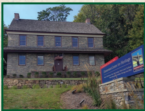
Zimmerman 遗产中心提供步道信息和萨斯奎哈纳河通道设施。