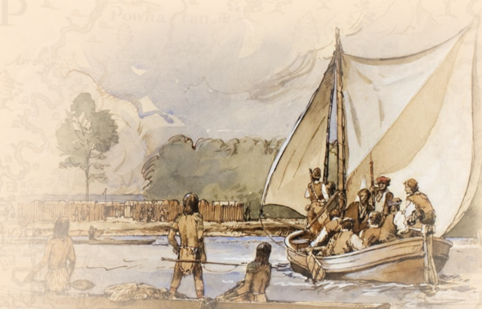
一艘小型敞篷船：学习彼此的语言对交流至关重要。约翰·史密斯和威廉·斯特雷奇（1611 年至 1613 年担任詹姆斯敦的秘书）记录了弗吉尼亚阿岗昆族语言的词汇，两人都提到了水这一词汇：suckahanna。斯特雷奇记录了几个表示船只的词，包括表示独木舟或小船的 aquoitan。其他的阿岗昆方言以及苏语和易洛魁语也在分水岭内使用。

在航行期间，史密斯参观了许多原住民社区。有些原住民一开始充满了谨慎和敌意，但史密斯通常会约束手下，初次见面的紧张气氛往往化解于贸易活动和宴会中。一路上，他得到了原住民导游和口译员的宝贵帮助。史密斯对这些航行的描述尽管带有一些偏见，但对于当今历史学家来说仍是重要的原始资料，其中记录了城镇的位置、外交习俗等。