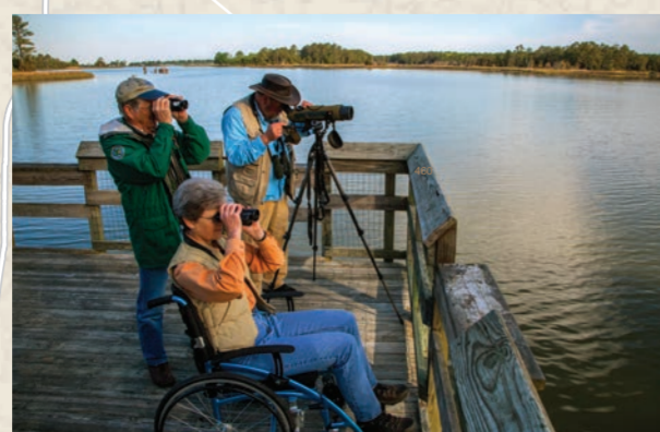
潮汐沼泽是观鸟者的天堂。