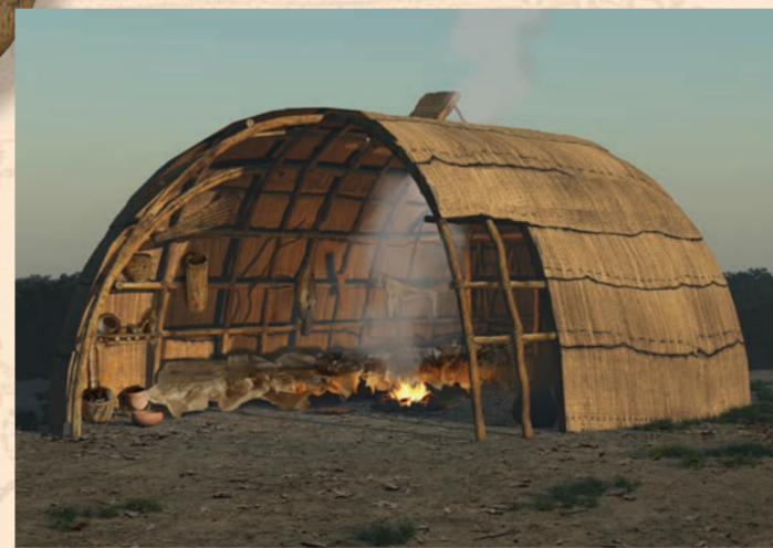
家庭住宅：长屋由弯曲的树苗制成的框架组成，上面覆盖着树皮板或编织的垫子，长屋的圆形形状和分层屋顶使其能够抵御风雨，其尺寸可能根据所需容纳的家庭成员的数量而有所不同。