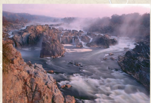
波托马克河上大瀑布的壮丽景色。

下载美国国家公园管理局应用程序。 这是一个免费的移动应用程序，可以在您 设备的应用程序商店下载。使用该应用程 序探索您附近的国家公园景点。查看互动 地图、公园景点游览、实地无障碍信息等， 以便在旅行之前和旅行期间规划您的国家 公园冒险之旅。