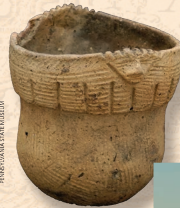
一条海湾，多种文化：陶器是切萨皮克原住民历史上常见的手工艺品，至今许多原住民工匠仍在实践这一传统，方法和设计因社区而异，并随着时间的推移而变化。例如，这艘船是宾夕法尼亚州苏斯克汉诺克人独有的，其衣领处有一张独特的人脸。

社区由长屋或称 yehakin 组成，大家庭一起住在一个屋檐下，许多任务由男女分工完成。男性主要担任渔民、猎人和士兵，而女性则负责耕种、觅食和建房。在冬季，或称 taquitock，他们会跟随鹿群迁徙前往内陆狩猎营地，这种生活方式依赖于严格的、世代相传的景观知识。