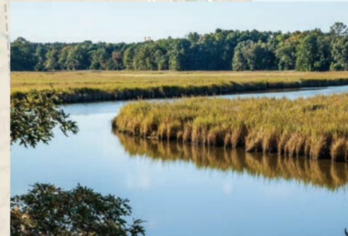
蜿蜒曲折的河道丰富了海湾的视觉魅力。