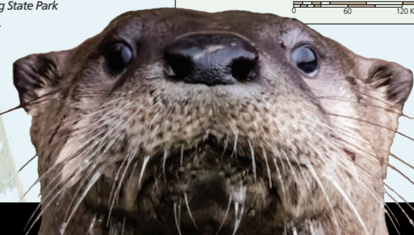
Cuitak 或 Rokayhook - 水獭 熊胆野鸭图/ GLEN MITCHELL