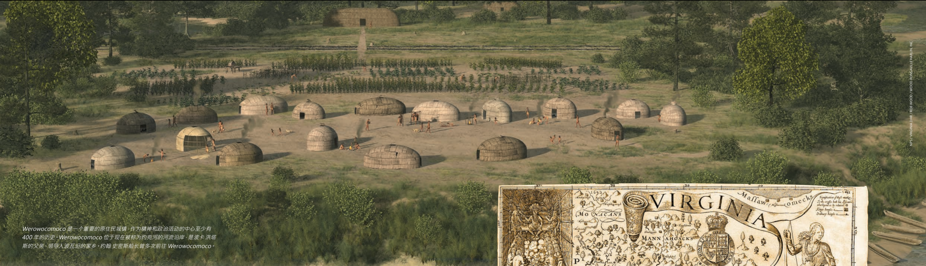
Werowocomoco 是一个重要的原住民城镇，作为精神和政治活动的中心至少有 400 年的历史。Werowocomoco 位于现在被称为约克河的河流沿岸，是波卡洪塔斯的父亲、领导人波瓦坦的家乡。约翰·史密斯船长曾多次前往 Werowocomoco。