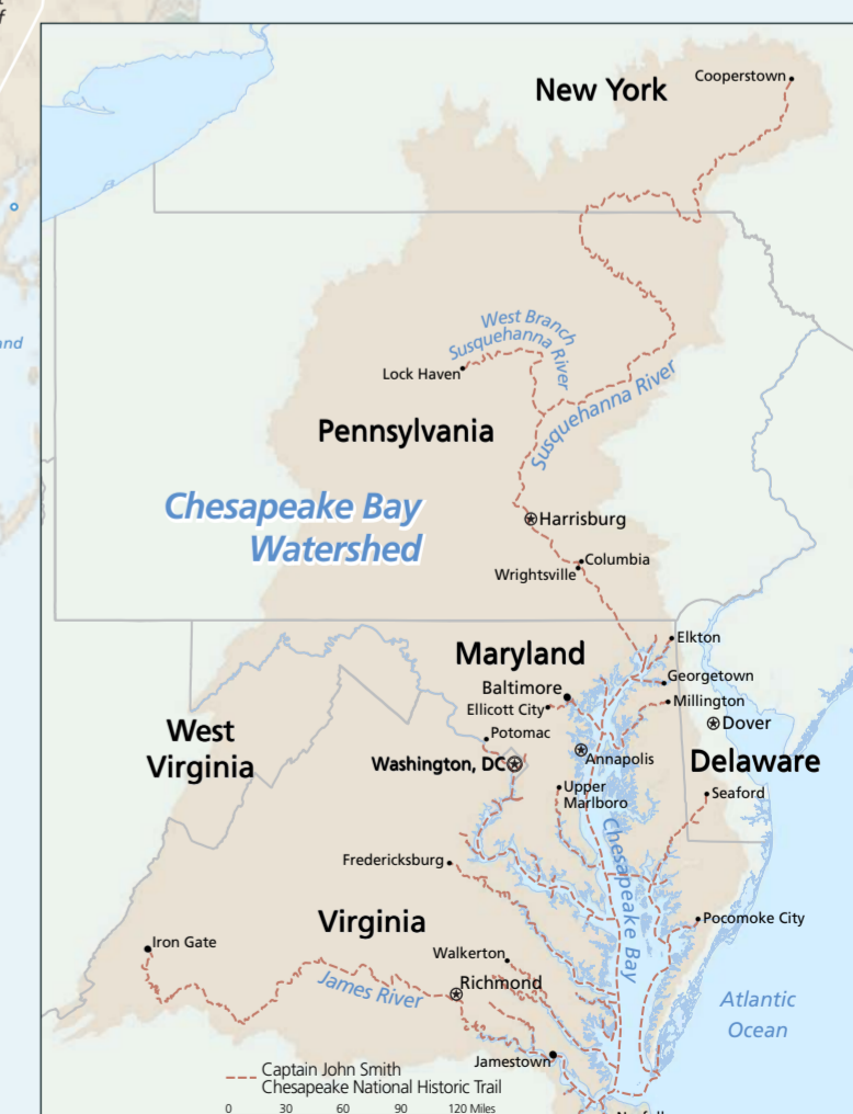
切萨皮克步道延伸到达史密斯探险路线之外，还包括了原住民使用的其他河流路线。