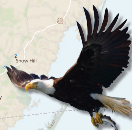
Opatenaiok - 鹰 ATLANTIC OCEAN