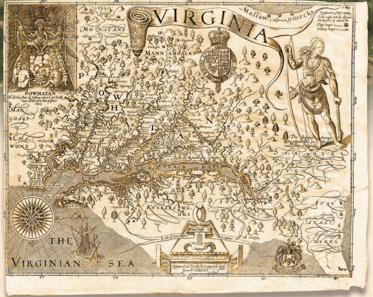
绘制切萨皮克地图：约翰·史密斯船长绘制的切萨皮克地图在当时非常精确，绘制时使用了指南针、日晷和碎木尺等导航工具。史密斯乘船并步行探索风景，原住民告诉他一些他没有去过的地方。

今天，您可以沿着约翰·史密斯船长切萨皮克国家历史步道了解史密斯的游记。无论是陆路还是水路，您会发现这条步道上各种各样的水路都各有迷人之处。