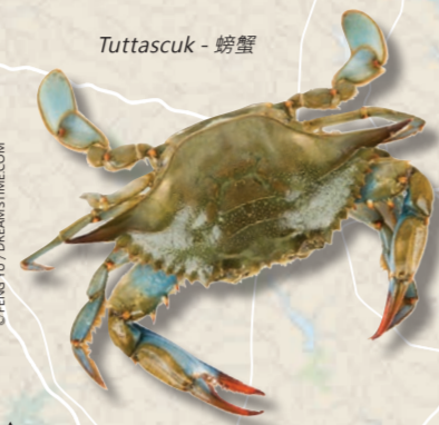
Tuttascuk - 螃蟹