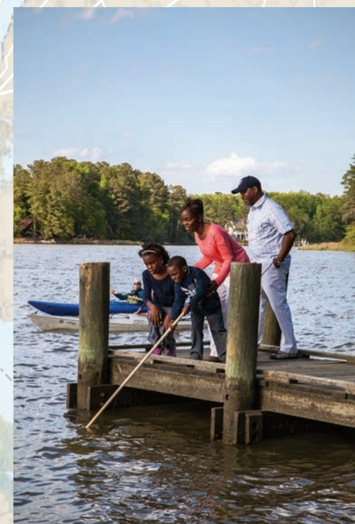
钓鱼是切萨皮克湾一项珍贵的传统。