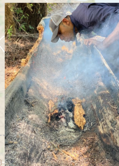
演示如何建造独木舟。